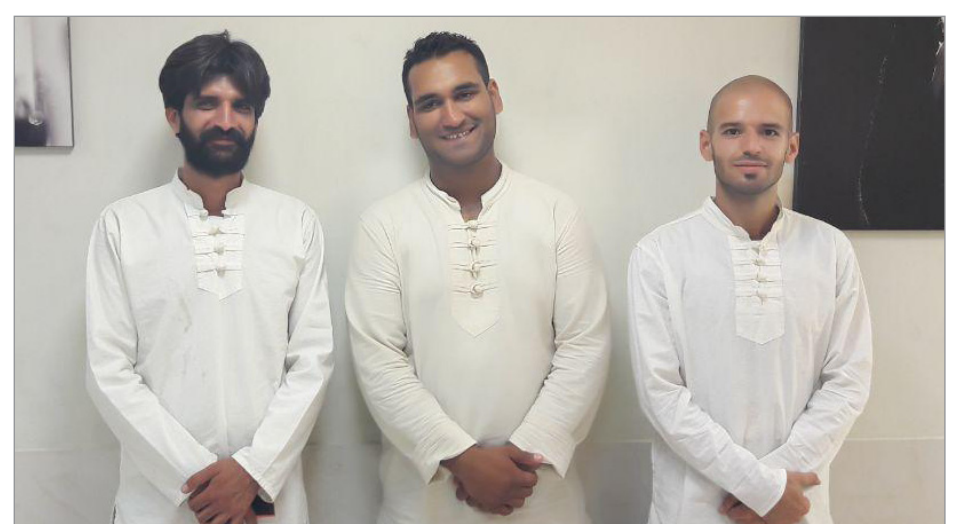
گزارش تصویری روز سوم بیست و هشتمین جشنواره تئاتر فارس