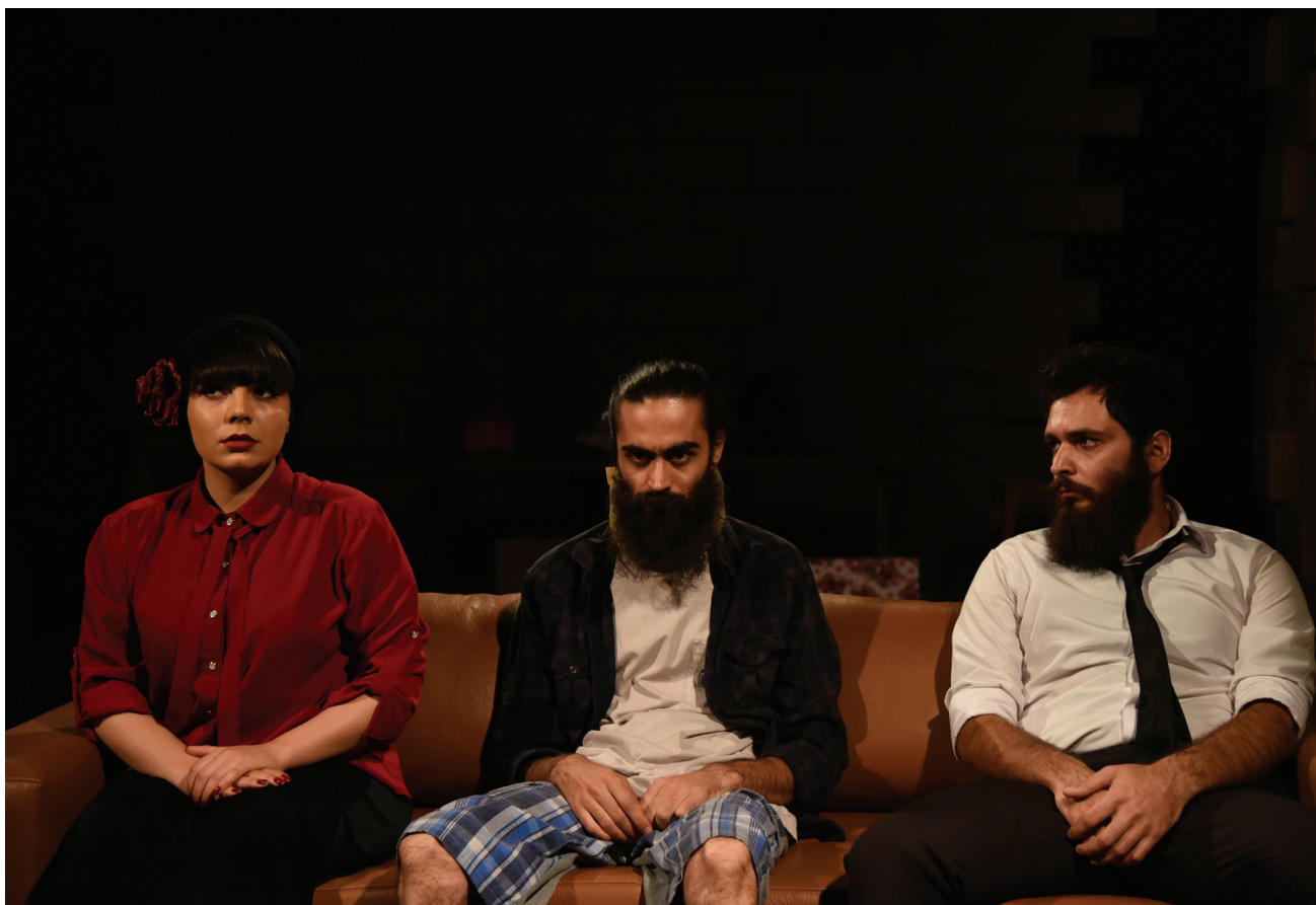
نمایش «آگورا»

با آن می جنگد یا شاید «نمی جنگد»!! شخصیت اصلی «آگورا» باید با دردهای عاطفی خود هم کنار بیاید و با درد دندان که آن را بدترین در دنیا می داند هم همین طور؛ دردی که که بخش اعظمی از مفاهیم فلسفی را در بطن خود پنهان کرده است و با خطوطی کم رنگ و باریک مخاطب را با شخصیت بهروز آشنا می کند. او در جشن تولدی ناخواسته قرار گرفته و این دردهای کوفتی اش را بیشتر می کند!