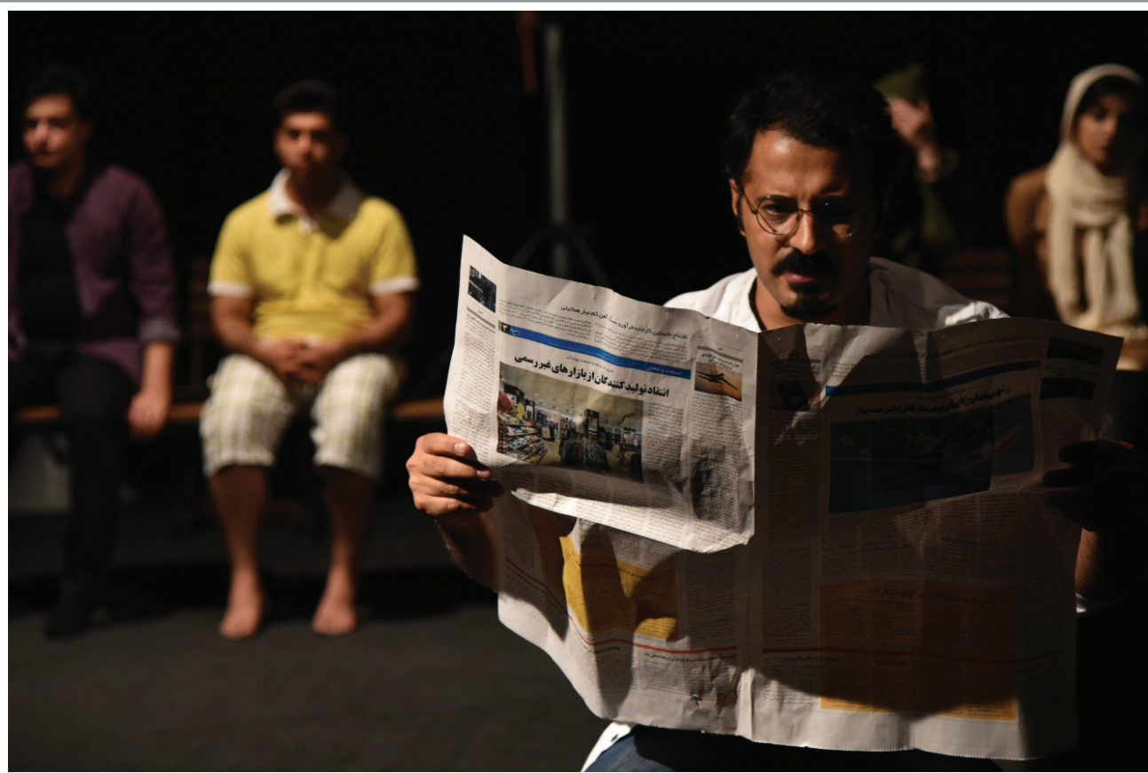
گروه برنا از لار اولین اجرا را در سالن سبز کلید زد